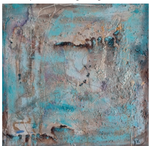
Materie schilderen de Zee - Yvonne Zwaan