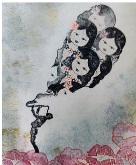
Workshop Stempelkunst - Jasper Boomsma