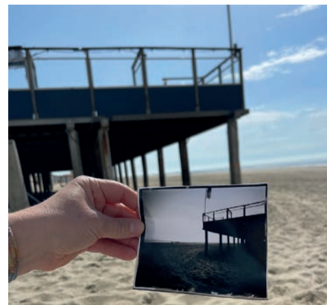
Workshop Pinhole fotografie - Geertje Wezelman