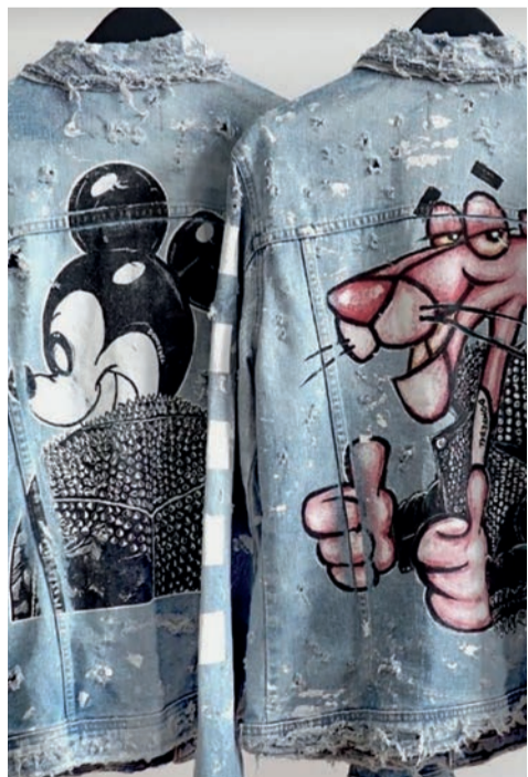
Kleding of tas beschilderen - Yvonne Zwaan