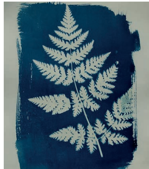
Workshop Cyanotype - Tineke Koks

Je gaat aan de slag met een "camera", een zwarte box zonder techniek van binnen. Dit is een analoge manier van fotograferen. Tijdens de workshop krijg je eerst uitleg over deze manier van fotograferen. De stappen die je gaat uitvoeren worden grondig besproken en uiteraard ga je fotograferen en je foto's afdrucken in de camera zelf. Dit proces heeft tijd nodig, maar je hebt gelijk resultaat. Het is een unieke ervaring, omdat je ter plekke jouw foto op een 'old school' manier maakt en zonder gebruik van een donkere kamer, afdruckt in de camera. Binnen de tijd kun je twee foto's maken. Indien er tijd over is kun je tegen een meerprijs nog een foto maken.