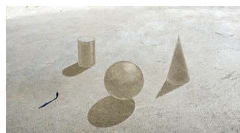
Lezing en workshop Zandkunst - Nico Laan